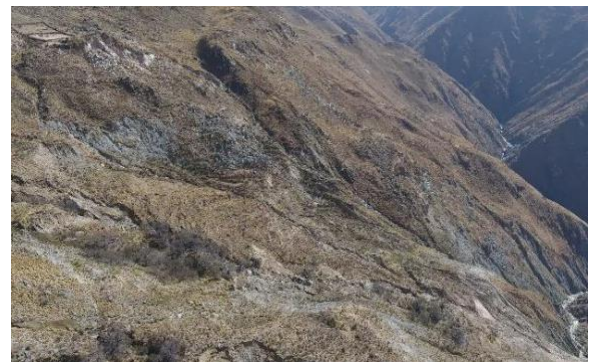
Fig. 3. Corona de despegue de deslizamientos de laderas en el terreno, Quebrada La Sala (2017). Arriba a la izquierda se observan los corrales del Puesto Carpanchay.

puesto ganadero de Carpanchay (margen izquierda). b. Imagen luego de los deslizamientos ocurridos en los años 2010 y 2011. c. Imagen luego de los deslizamientos de 2015. Se aprecia la intensificación de la zona de colapso en las laderas de margen izquierda. d. En verde se observan los bosquecillos de aliso del cerro. Entre 2003 y 2018 se han detectado incremento de los sectores colapsados (indicadas con el grosor de las flechas), nuevas zonas potenciales de colapsos de ladera (cercana al puesto), zonas de re-vegetación natural post-colapso (círculos) y zonas arrasadas por flujo denso entre 2016-2018 (rectángulo).