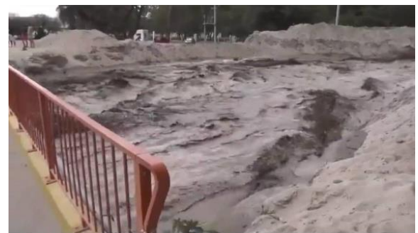
Fig. 4. Imagen del video filmado 28/01/19 aluvión o flujo denso sobre puente carretero.

Las zonas altas de la cuenca corresponden a pastizales altoandinos, con numerosas vegas, donde pastorean llamas, guanacos y vicuñas (4.000-4.900 m.s.n.m.). En las laderas de las serranías ubicadas entre 3.000 -4.000 m.s.n.m. se presentan pastizales de la Puna combinados con humedales de tipo vegas o ciénegas asociadas a pajonales puneños, con numerosas vertientes