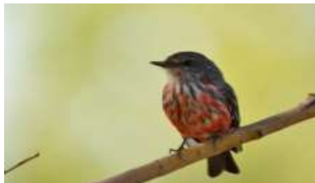
Fig. 4: Churrinche ( Pyrocephalus rubinus ), especie migratoria, visitante estival de Patagonia, donde se reproduce.

También se registraron especies, que, si bien poseen amplia distribución, son locales y poco común en la Patagonia (ver Fig. 5 y 6).