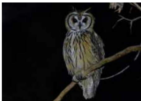
Fig. 6: Lechuzón orejado ( Asio clamator ), si bien es una especie común, existen muy pocos registros en nuestra región. Residente permanente.

El presente trabajo ha permitido una primera aproximación a indagar sobre procesos ecológicos complejos y no lineales que se desarrollan en el paisaje a través de la focalización en uno de sus componentes indicadores como son las aves.