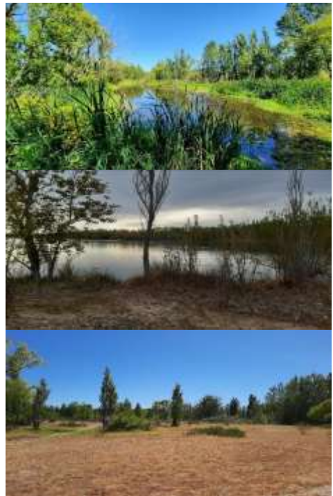
Fig. 2: Ambientes ribereños asociados a los puntos de observación de aves relevados: humedales, lecho fluvial y pastizales.

Paralelamente, dicha información fue complementada con el registro de la totalidad de las especies observadas u oídas durante cada relevamiento (independientemente de los registros sistematizados) con el objeto de poder visibilizar el uso del espacio de manera más integral. Los puntos de observación se asocian a humedales urbanos ribereños comprendidos por la cota de inundación del río Limay de 1740 m 3 /s y por el tipo funcional de su vegetación dominante (acuática, riparia y pastizales palustres o halófitos).