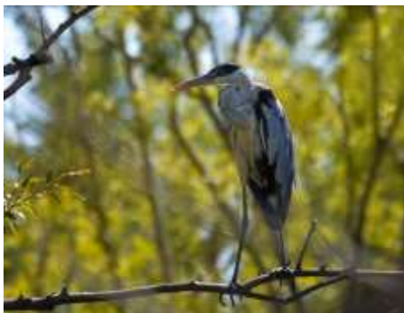
Fig. 3: Garza mora ( Ardea cocoi ), una de las especies de garzas más grandes de nuestra región, asociada a ecosistemas acuáticos. Residente permanente.

Las aves se categorizaron también en especies residentes y especies migratorias (muchas de las cuales visitan la región en temporada estival donde se reproducen). En este sentido, del total de especies registradas, 8 fueron migratorias (visitantes estivales), entre las cuales se pueden citar: Jote cabeza colorada ( Cathartes aura ), Atajacaminos ñañarca ( Systellura longirostris ), Fiofio silbón ( Elaenia albiceps ), Suirirí real ( Tyrannus melancholicus ), Churrinche ( Pyrocephalus rubinus ), Tijereta ( Tyrannus savana ), Golondrina negra ( Progne elegans ), Golondrina barranquera ( Pygochelidon cyanoleuca ).