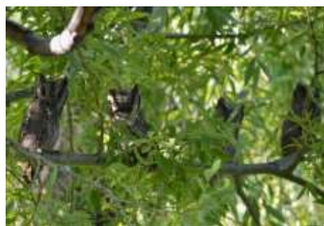
Fig. 5: fotografía de ejemplares adultos y juveniles de alliticucu común ( Megascops choliba ), de difícil observación diurna por sus hábitos nocturnos y solitarios. Residente permanente.

El presente trabajo ha permitido una primera aproximación a indagar sobre procesos ecológicos complejos y no lineales que se desarrollan en el paisaje a través de la focalización en uno de sus componentes indicadores como son las aves.